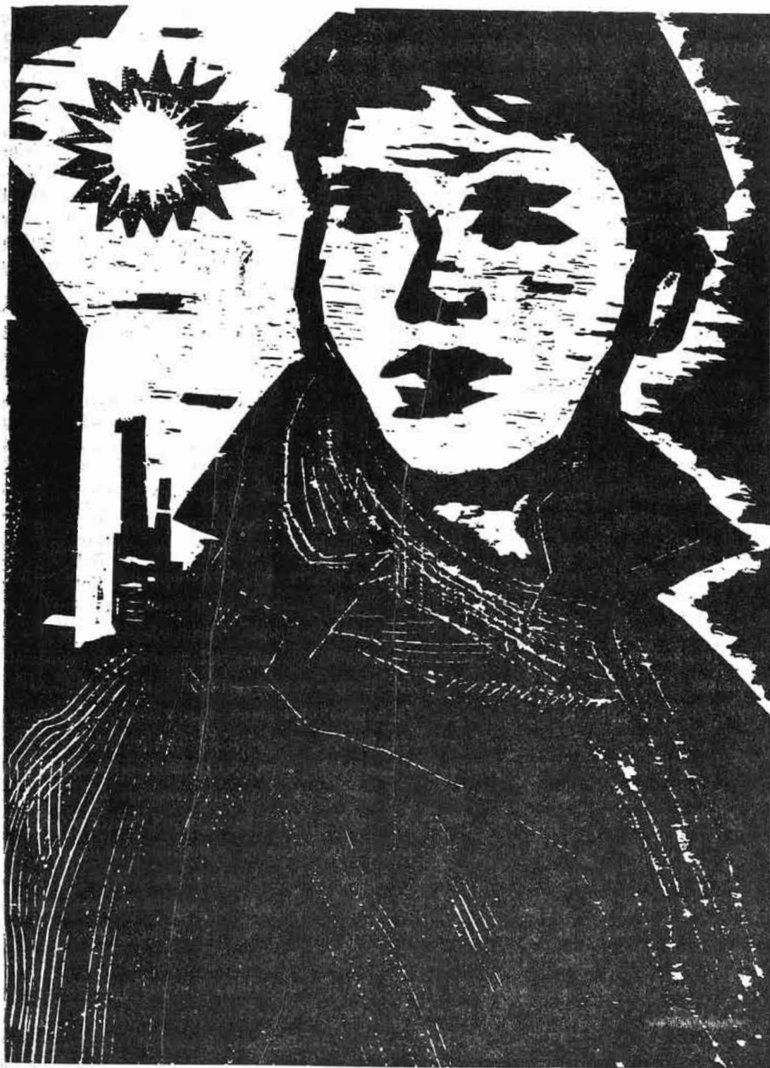
G. Kružič, Partizánska stráž, drevorez (82).